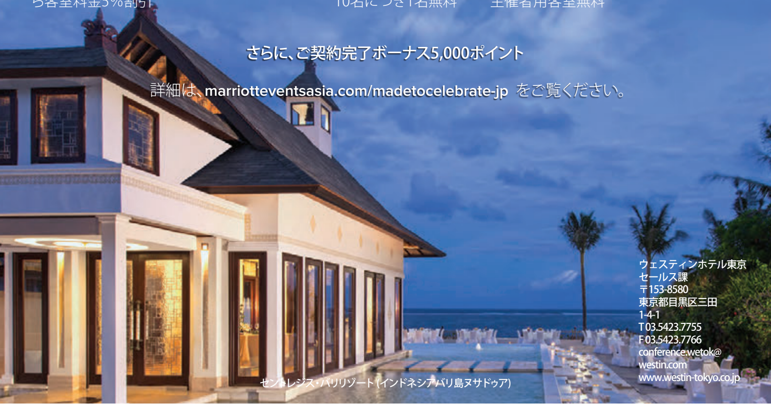
セントレジス・バリリゾート (インドネシアバリ島ヌサドゥア)

詳細は、 marriotteventsasia.com/madetocelebrate-jp をご覧ください。